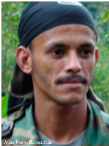
Alias Pedro Baracutado